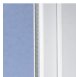
klasszikus design enyhén kerekített élekkel

A VEKA profilból készült korszerű műanyag nyílászárókkal minden ház csak nyerhet. A SOFTLINE rendszerek klasszikus vonalvezetése az enyhén lekerekített élekkel időálló és kitűnően harmonizál a legkülönbözőbb építészeti stílusokkal – legyen modern vagy hagyományos, új ház vagy felújítandó épület.