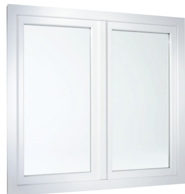
Kétszárnyú ablak eltöltött síkú változatban